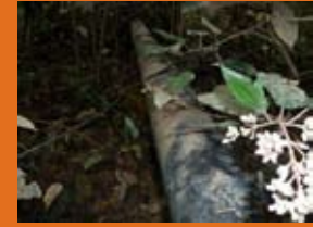
El virus a la selva

Les emissions de contaminants provoca greus problemes de salut i el deteriorament de les condicions de vida a les poblacions indígenes d'aquestes zones. Estudis realitzat al Perú per part del Ministeri de Salut l'any 2005 han demostrat els elevats nivells de cadmi a la sang (molt per sobre dels admesos per l'Organització Mundial de la Salut) de les comunitats indígenes properes a les activitats extractives. L'Agència Americana de Protecció del Medi Ambient ha determinat que elevats nivells de cadmi a la sang són altament perjudicials per als pulmons, per a l'estómac (ocasiona irritacions greus) i per als ossos (provoca fragilitat), i, a més a més, l'Agència ha determinat que el cadmi i els seus compostos són cancerígens (carcinogènics) en éssers humans.