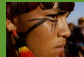
Reserva indígena de Xingu, Brasil

El desconeixement que en tenim ha portat a una concepció sovint negativa dels pobles indígenes. Els avenços en antropologia i gestió de recursos, entre d'altres, estant demostrant, però, que els models de vida indígenes ofereixen contribucions molt interessants per a un desenvolupament sostenible de la selva amazònica. La intenció d'aquesta campanya és, doncs, desgranar cadascun dels aspectes pels quals estan lluitant aquests pobles i denunciar la seva situació de fragilitat davant el procés homogeneïtzador que representa la globalització tant des del punt de vista econòmic com cultural. Entre els aspectes més destacats es tractarà el dret a la terra d'aquestes comunitats; l'impacte socioeconòmic d'empreses multinacionals en territoris indígenes; la sostenibilitat mediambiental d'algunes activitats extractives a l'Amazònia i l'ús que els indígenes fan del medi ambient; els canvis en les cultures indígenes i les seves perspectives de futur.