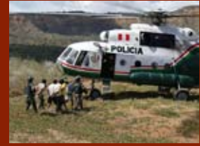
Enfrontaments amb els cossos d'operacions especials a la ciutat de Bagua.

Darrerament les comunitats ja no estan tan soles. Hi comença a haver moviments socials, especialment en el món ecologista o en la defensa dels drets dels pobles que entenen la seva lluita i els donen suport, convençuts que l'acció d'aquestes empreses no només afecta les comunitats que viuen a la zona, sinó que té conseqüències d'abast mundial.