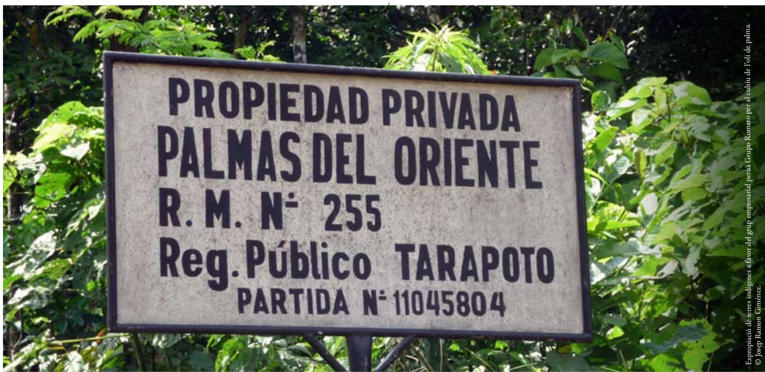
Expropiació de terres indígenes a favor del grup empresarial per al Grup Romero per al cultiu de palma.

En molts països, més del 50% de la població indígena viu a les ciutats. Durant les últimes tres dècades, els pobles indígenes s'han desplaçat de les seves terres tradicionals cap a zones urbanes buscant oportunitats educatives i laborals, però també, a causa dels abusos i de les violacions dels drets humans, principalment pel que fa als seus drets territorials i a la seva supervivència cultural.