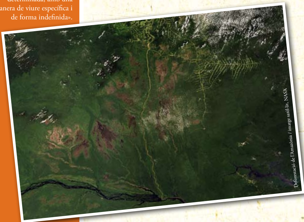
Deforestació de l'Amazònia

La petjada ecològica és un indicador afegit definit com «l'àrea de territori ecològicament productiva (cultius, pastures, boscos o ecosistemes aquàtics) necessària per produir els recursos utilitzats i per assimilar els residus produïts per una població determinada, amb una manera de viure específica i de forma indefinida».