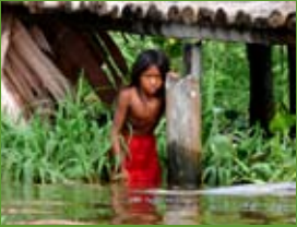
Delta Amacuro, Venezuela

L'absència de dades sobre les condicions de vida dels pobles indígenes, els seus nivells d'ingrés, l'ocupació, l'accés als serveis bàsics sanitaris i de salut, pràctiques mèdiques tradicionals i accés a aliments dificulta que les administracions corresponents desenvolupin les polítiques apropiades per a la millora de la seva qualitat de vida.