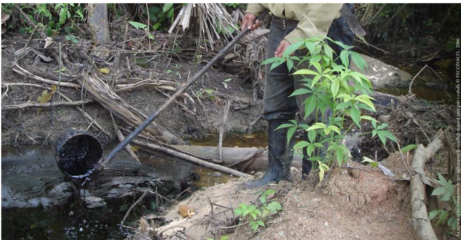
La reparació de vessaments de cru mitjançant la recollida manual amb pals i cubells

Les explotacions sempre comporten una gran quantitat d'emissions de contaminants. A l'aire s'emeten gasos com ara CO 2 i SO 2 , principals causants de l'efecte hivernacle i de la pluja àcida. A l'aigua i al subsòl s'hi aboquen dioxines i derivats de l'ús del cianur, arsènic i mercuri entre d'altres.