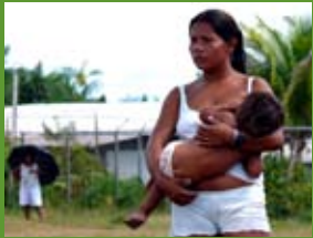
Amazònia, Veneçuela.