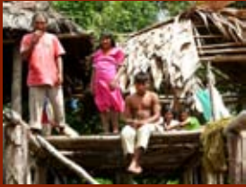
San Francisco de Guayo, Delta Amacuro, Veneçuela.

En molts països, més del 50% de la població indígena viu a les ciutats. Durant les últimes tres dècades, els pobles indígenes s'han desplaçat de les seves terres tradicionals cap a zones urbanes buscant oportunitats educatives i laborals, però també, a causa dels abusos i de les violacions dels drets humans, principalment pel que fa als seus drets territorials i a la seva supervivència cultural.