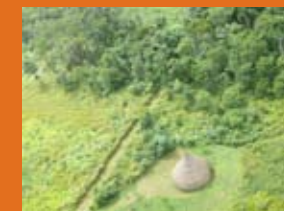
Amazònia, Venezuela

La proporció aproximada de població indígena en els principals països amazònics és, segons els censos de l'any 2008 (Font: CEPAL):