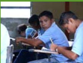
San Francisco de Guayo, Delta Amacuro, Veneçuela.

Més de 100 companyies farmacèutiques estan finançant actualment projectes per estudiar els coneixements indígenes sobre plantes que encara usen.