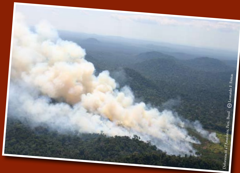
Deforestació a l'Amazònia, Pará, Brasil.

“A LA TERRA HI HA TOT EL QUE CAL PER SATISFER LES NECESSITATS DE TOTS, PERÒ NO TANT COM PER SATISFER-NE L'AVARÍCIA D'ALGUNS”. (GANDHI)