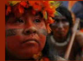
Fòrum social mundial, Belém 2009

El rescat dels coneixements i sabers ancestrals és crucial per a la inserció econòmica, social, política i cultural en la ciutadania moderna. El fet que la nova societat multicultural respecti i rescati el coneixement ancestral farà que sigui cada vegada més pròspera. Aquests coneixements i sabers dels pobles indígenes són tan actuals que només cal visitar una comunitat indígena per observar com es mantenen les tradicions per escollir l'autoritat o els rituals per iniciar la sembra, com preparen els aliments de manera ecològica o quins són els processos d'aprenentatge dels nens, els coneixements dels quals es transmeten de generació en generació. El que falta és que els estats donin un impuls més gran a aquesta dinàmica per tal de permetre la inserció en el mercat global i permetre que competeixin amb els seus propis coneixements, vestimentes, idioma, alimentació i identitat.