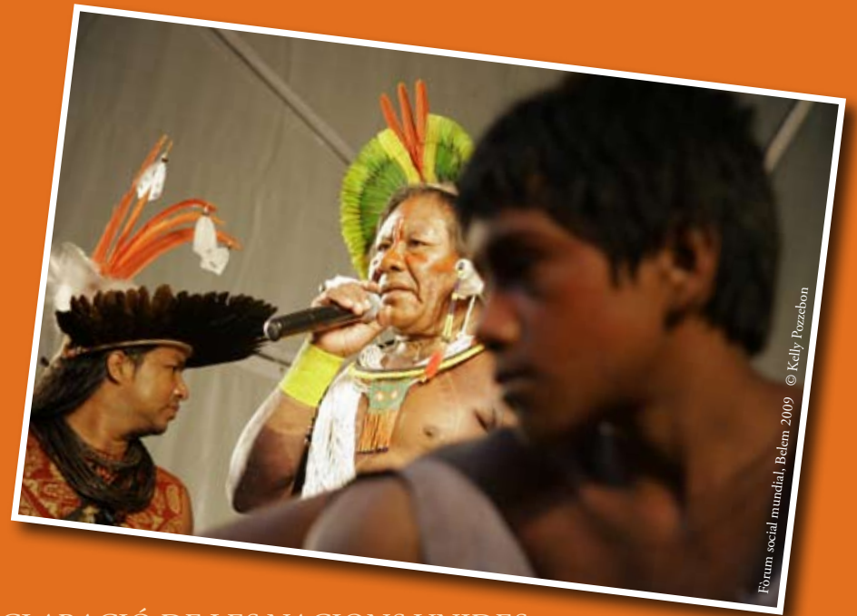
Forum social mundial, Belém 2009

Espanya va ratificar aquest conveni l'any 2007 i quasi va passar desapercbut per a l'opinió pública. La ratificació, però, té implicacions directes sobre les activitats d'empreses espanyoles en territoris indígenes entre d'altres.