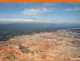
Vista aèria d'una mina a l'Amazònia al sud-est de Perú