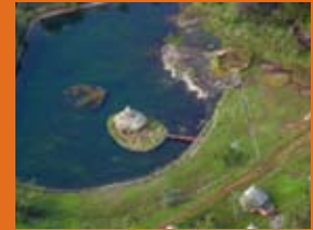
Amazònia, Veneçuela

El futur i la capacitat de desenvolupament dels pobles indígenes que viuen a l'Amazònia depenen en gran part de la seva capacitat de superar, amb la seva pròpia iniciativa, els greus problemes associats amb la propietat de la terra. Una investigació de l'Institut Internacional d'Anàlisi de Sistemes Aplicats augura que per a l'any 2030 seran necessàries 515 milions d'hectàrees més per a l'agricultura, biocombustibles i producció de fusta, cosa que augmentarà la pressió sobre els boscos i els territoris que ocupen aquests pobles.