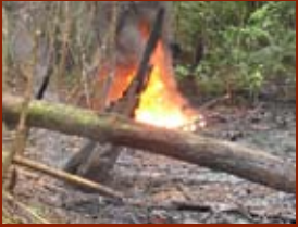
Reparació de vessaments mitjançant la crema in situ, alliberant tots els contaminants i dificultant-ne la seva recuperació del medi

Les explotacions sempre comporten una gran quantitat d'emissions de contaminants. A l'aire s'emeten gasos com ara CO 2 i SO 2 , principals causants de l'efecte hivernacle i de la pluja àcida. A l'aigua i al subsòl s'hi aboquen dioxines i derivats de l'ús del cianur, arsènic i mercuri entre d'altres.