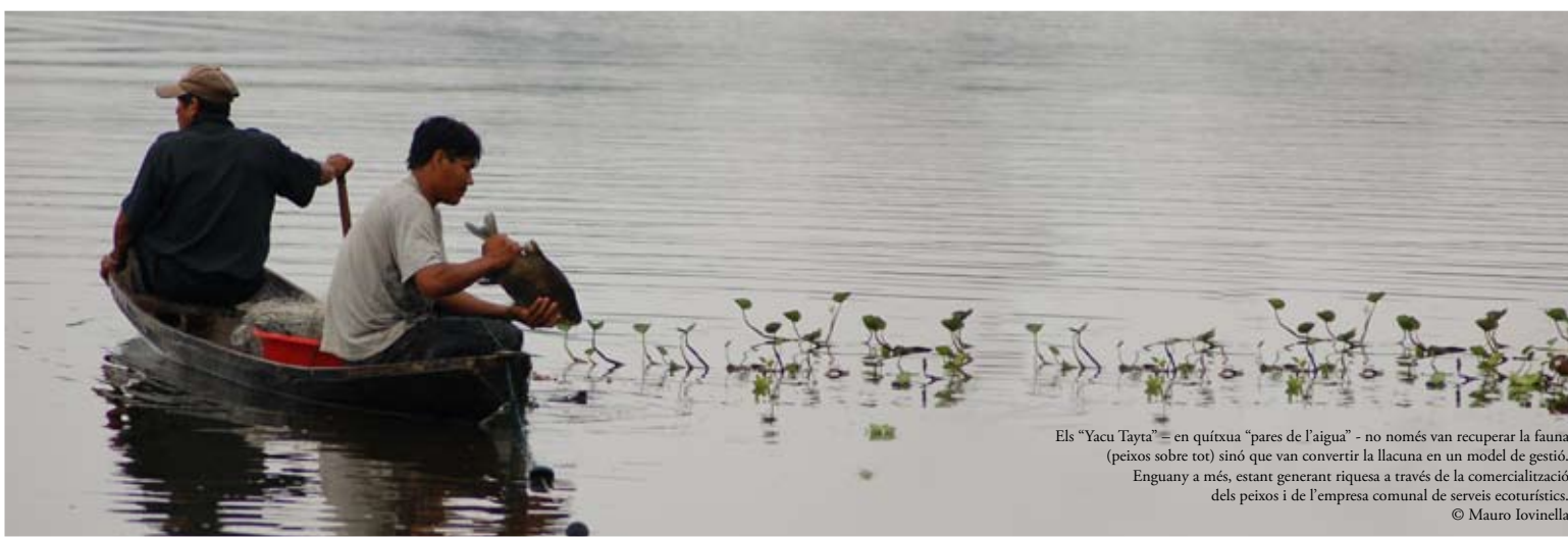
Els “Yacu Tayta” – en quítxua “pares de l'aigua” - no només van recuperar la fauna (peixos sobre tot) sinó que van convertir la llacuna en un model de gestió. Enguany a més, estant generant riquesa a través de la comercialització dels peixos i de l'empresa comunal de serveis ecoturístics.

En el passat Fòrum Social Mundial (Belém, 2009), celebrat a Brasil i caracteritzat per la participació i el lideratge dels moviments indígenes, es va fer ressò de les propostes concretes d'aquests col·lectius que reclamen l'alli causay – “bon viure” en quítxua, que explica en dues paraules un nou concepte de desenvolupament que ja ha estat recollit en les constitucions de l'Equador i Bolívia: viure bé, ni amb més ni amb menys diners, ni amb més ni amb menys propietats; sinó amb allò que es necessita per viure amb dignitat, amb oportunitats, amb capacitat d'incidir, d'opinar, de créixer, de proposar i aprendre. Són propostes concretes d'altres maneres de viure que plantegen models sostenibles de creixement, i fins i tot de decreixement si la situació ho demana. Són unes accions que d'entrada sobten perquè proposen canvis d'actitud radicals sobre com consumim i ens relacionem i que també es poden aplicar en les societats nord-occidentals.