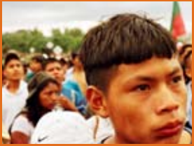
Marxa indígena, Colòmbia

A l'últim congrés de la Unió Internacional de Conservació de la Naturalesa (UICN), celebrat a Barcelona l'octubre del 2008, hi va haver la representació de líders indígenes americans, africans i asiàtics, que es van fer ressò de les protestes pel que fa a les mesures que estant adoptant els països contaminants per combatre el canvi climàtic. Entre les principals mesures es troben el comerç dels drets d'emissió o la creació de zones protegides d'on són expulsades les comunitats indígenes. Ara es parla de protegir els boscos, per això els governs donen concessions a companyies que facin aquests serveis en territoris indígenes i els científics creen àrees protegides en zones que els pobles indígenes sempre han conservat. Aquestes polítiques governamentals es porten a terme, de manera llastimosa i injusta, amb escassa representació dels pobles a qui afecten.