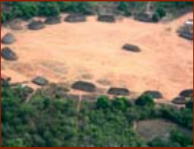
La aldea Kuikuro de Ipatse