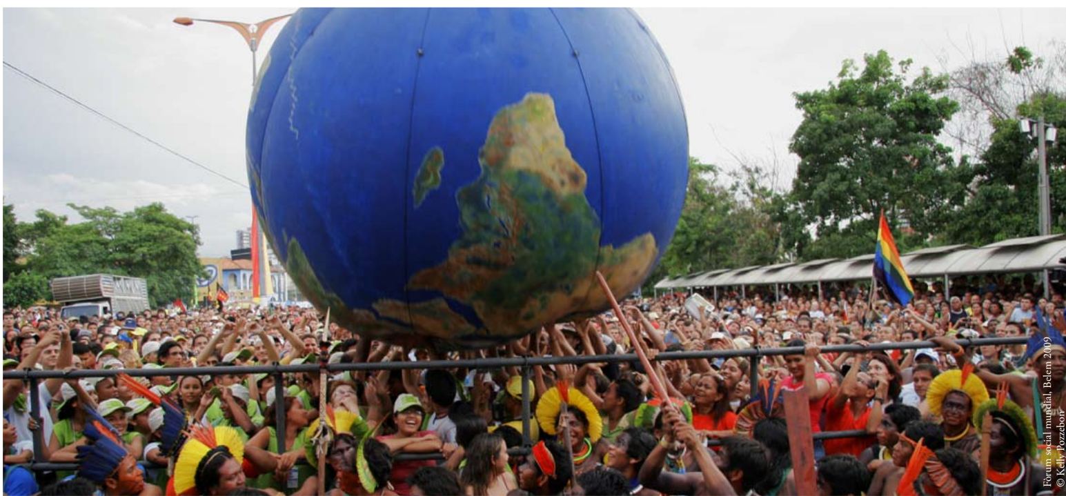
Forum social mundial, Belem 2009

A l'últim congrés de la Unió Internacional de Conservació de la Naturalesa (UICN), celebrat a Barcelona l'octubre del 2008, hi va haver la representació de líders indígenes americans, africans i asiàtics, que es van fer ressò de les protestes pel que fa a les mesures que estant adoptant els països contaminants per combatre el canvi climàtic. Entre les principals mesures es troben el comerç dels drets d'emissió o la creació de zones protegides d'on són expulsades les comunitats indígenes. Ara es parla de protegir els boscos, per això els governs donen concessions a companyies que facin aquests serveis en territoris indígenes i els científics creen àrees protegides en zones que els pobles indígenes sempre han conservat. Aquestes polítiques governamentals es porten a terme, de manera llastimosa i injusta, amb escassa representació dels pobles a qui afecten.