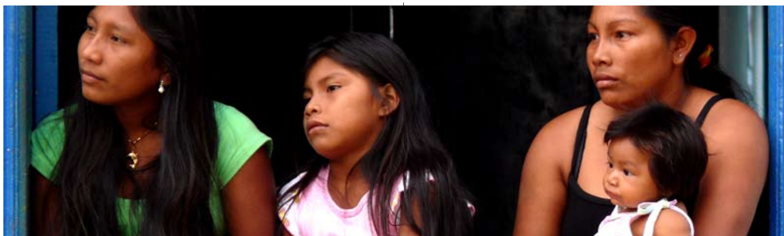
Amazònia, Veneçuela.