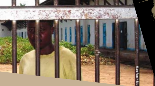
Hugo Banti / RMN